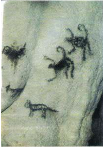
Dibujos en la roca. Testigos del paso de viejas civilizaciones.

Canoas Infiabes en el cauce subterráneo. La luz del sol penetra por un par de aberturas en la roca señalado por la flecha.